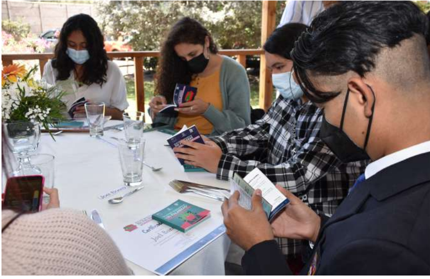
Obras literarias fueron plasmadas en un libro que quedará como material bibliográfico para los y las estudiantes y sus establecimientos.

Con una ceremonia de reconocimiento se dio el cierre del Concurso "No se PACE: microcuento en 100 palabras", en su segunda versión denominada "En línea: relatos de una adolescencia en pandemia", organizado por el Programa PACE de la Universidad de Tarapacá y en el cual participaron estudiantes de los liceos adscritos a esta iniciativa del Ministerio de Educación.